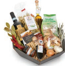
Korb Mediterran: CHF 95.– Alles, was es für die feine mediterrane Küche braucht.

Möchten Sie zum Jahresende Ihren Mitarbeitenden, Kunden oder Geschäftspartnern eine Freude bereiten? Die liebevoll zusammengestellten Geschenkkörbe oder Geschenktagen aus dem Quai4-Markt bieten die perfekte Überraschung. Und Sie unterstützen damit eine gute Sache. Gerne nehmen wir Ihre Wünsche am Telefon entgegen (041 368 99 90) und beraten Sie bei der Zusammenstellung. Für die Lieferung können Sie den Hauslieferdienst in Anspruch nehmen.