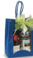
Tasche Klein: CHF 27.– Ein kleiner kulinarischer Gruss aus dem Luzernischen.