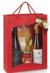
Tasche Gross: CHF 66.– Mit erlesenem Wein und leckerer Pasta auf den Geschmack kommen.