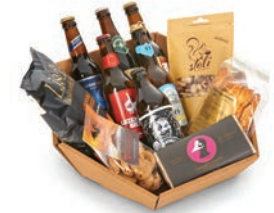
Korb Apéro: CHF 57.– Bier und Knabberspass für den besonderen Apérogenuss.