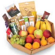
Korb Fitness: CHF 63.– Gesundes, Frisches und Nahrhaftes, um die Energiespeicher zu füllen.