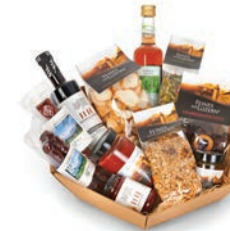
Korb Regional: CHF 99.– Feines und Gluschtiges, Süsses und Salziges aus der Region Luzern.