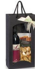
Tasche Mittel: CHF 52.– Ein guter Tropfen mit Knusprig-Würzigem für den kleinen Apéro.